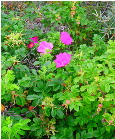
Kurtturuusu (Rosa rugosa)

Kurtturuusun torjunta vaatii aikaa ja sitkeyttä. Aloita kiskomalla pienet taimet. Kookkaampiin yksilöihin tarvitaan tukevien hanskojen lisäksi työkaluja. Ensin pensas leikataan esim. oksasaksilla tai raivaussahalla tyveä myöten alas. Sen jälkeen päästään kaivamaan juurakkoa maasta. Hiekkamaasta juurakko irtoaa suhteellisen helposti, kivikossa työskentely on työläämpää.