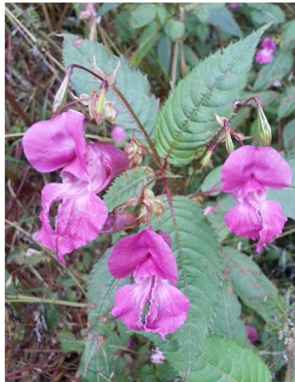
Jättipalsami (Impatiens glandulifera)

Jättipalsamia on helppo torjua kitkemällä tai niittämällä ennen siementen muodostumista. Se lähtee helposti versomaan kompostikasalla, joten se tulisi polttaa tai kerätä jätesäkkeihin. Jos laji on vasta leviämässä, peittäminen mustalla muovilla on käyttökelpoinen hävityskeino niiton jälkeen.